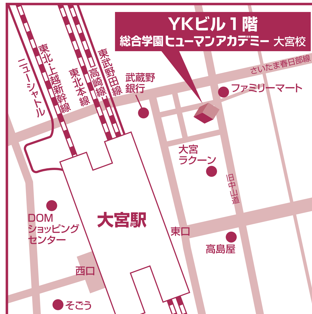
JR・東武線大宮駅「東口」より、徒歩5分

〒330-0802 埼玉県さいたま市大宮区宮町1-103-1 YKビル1階 ☎ 0120-992-038 FAX 048-615-4387 https://ha.athuman.com/ [E-mail] omiya@athuman.com