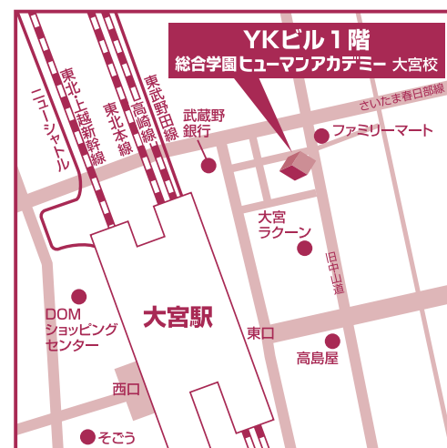
総合学園ヒューマンアカデミー 大宮校 入学事務局

〒330-0802 埼玉県さいたま市大宮区宮町1-103-1 YKビル1階 ☎ 0120-992-038 FAX 048-615-4387 https://ha.athuman.com/ [E-mail] omiya@athuman.com