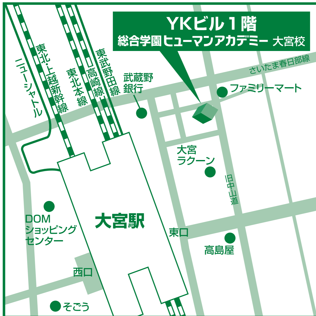
JR・東武線大宮駅「東口」より、徒歩5分