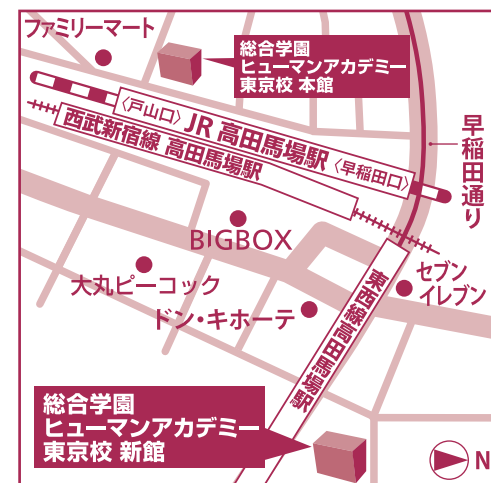
総合学園ヒューマンアカデミー 東京校 入学事務局

☎ 0120-89-1588 FAX 03-6892-2160 https://ha.athuman.com/ [E-mail] tbo23@athuman.com