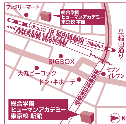
総合学園ヒューマンアカデミー 東京校 入学事務局

〒169-0075 東京都新宿区高田馬場2-14-17 ヒューマン教育センター第2ビル